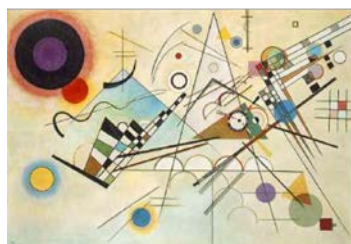
カンディンスキー

はじめにマウスがロシアの抽象画家カンディンスキーとオランダ出身の抽象画家モンドリアンのどちらの絵の近くに長く滞在するかを調べましたが、ほとんどのマウスは滞在時間の差、つまり絵に対する好みを示しませんでした。ピカソとルノアールでもやはり好みを示しません。